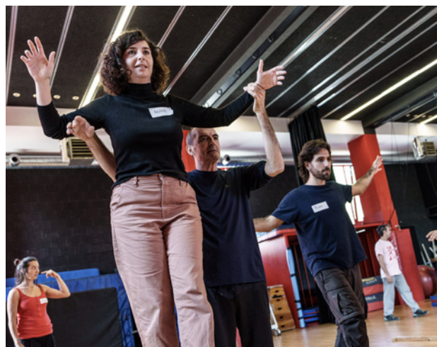
Taller d'equilibris.