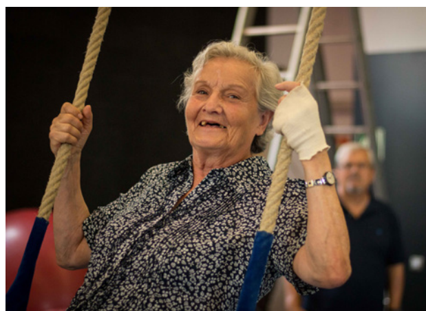
Participants d'El Gran Circ practiquen malabars i trapezi.