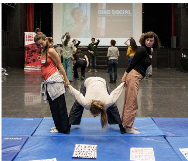
Taller d'acrobàcia.

S'ha plantejat que, encara que les persones grans no puguin fer certs moviments, no s'ha d'anul·lar les seves capacitats abans d'hora. Les formadores han destacat la importància d'escoltar el col·lectiu i d'evitar moviments que puguin resultar incòmodes, com posar-se de genolls o muntar i desmuntar els exercicis massa ràpid. També s'ha remarcat que s'han d'evitar exercicis que requereixin una quadrupèdia en què una persona es col·loqui sobre una altra. Per a l'activitat, s'han utilitzat pilotes de massatge plantar (recomanat fer-ho a l'inici de la pràctica) i coixins per sota el cap. A més, s'ha treballat amb exercicis que combinen cognició i moviment per a persones grans, utilitzant l'alfabet com a base per crear un "abecedari personal" amb els moviments del cos. Els exercicis d'equilibri han inclòs jocs de contrapesos entre cossos, aprenent a compensar el pes aixecant un braç per ajudar-se a mantenir l'estabilitat. També s'han fet figures amb el cos per parelles, formant lletres de l'alfabet.