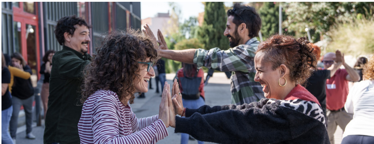
Escalfament per parelles.