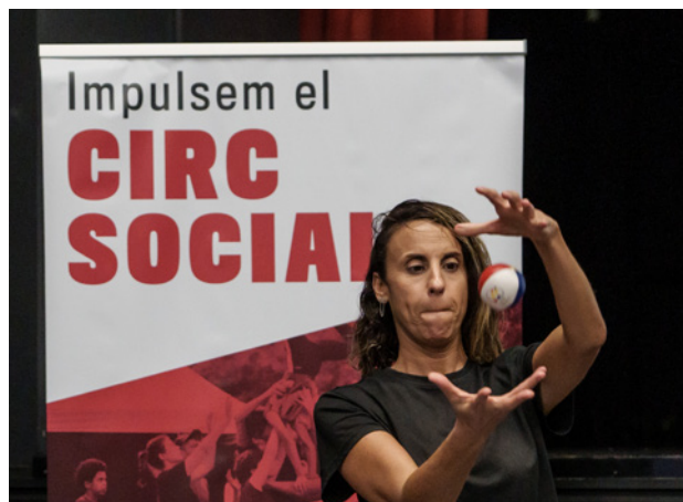
Taller de malabars.